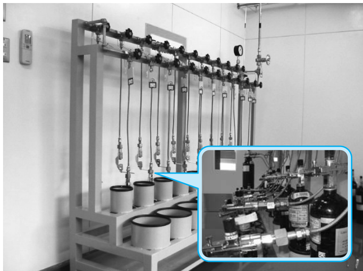
【直列式・ちどり型充填架台 施工例】※ヨークバルブ対応クイック・クランプ使用

直列式・ちどり型充填架台, 直列式・水平型充填架台施工例 (ヨーク・バルブ対応クイック・クランプ使用) 直列式充填架台 (ワンタッチ充填金具: いちおし君使用), 液化酸素自動充填装置 (積層断熱真空配管使用)